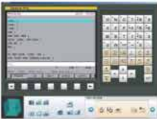
CNC Kontrol Ünitesi Fonksiyonları